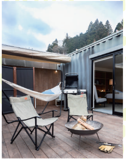
中庭のように使えるキャビン・コテージのデッキ。星空の下でジャグジーに浸ったり、星空の下で焚火したりと好きなように過ごせる