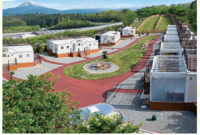
宿泊するキャビンはスイートとスタンダードの2タイプ。全室バスルーム、ウッドデッキ付きで、スイート棟はジェットバスも完備。愛犬との滞在も可能。宿泊者は別館「ホテルワイナリーヒル」の大浴場(温泉)も利用できる※別館が休館の場合は不可