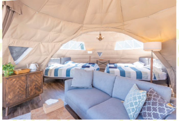
元校庭ということを知るほどの豪華なテント内(写真はツインドーム)。ほか、ログハウス調のオペラテント、ペット同伴OKのテントも。旧校舎には大浴場やサウナ、プレイルームがあり、懐かしさも感じる贅沢な空間だ