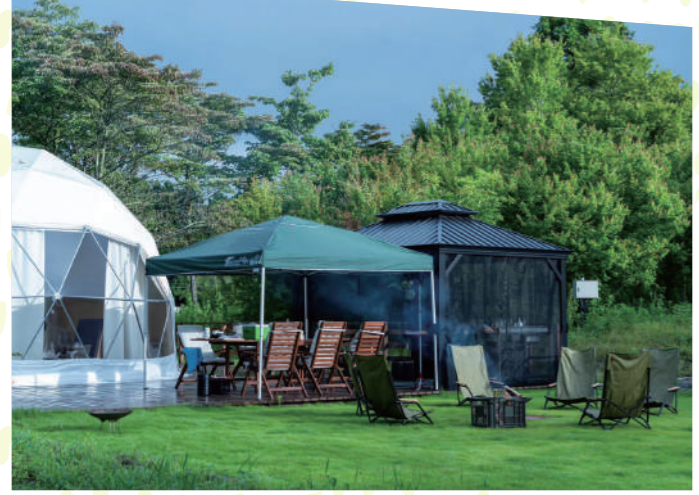
冷涼な気候と高地ならではの満天の星を楽しめる朝霧高原は、豊かな緑に包まれた人気の避暑地。夕食は高原の美食が並ぶBBQ、朝食は羽釜で炊くかまどご飯かホットサンドのいずれかを選べる。施設内で生ビールを味わえるのも嬉しい