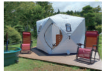
敷地内には、プライベートサウナを完備。水風呂もあり、心も体もリフレッシュできる