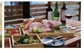
1.大型ドーム型テントは全棟棟付き。家具メーカー「キシル」とのコラボテントやドッグラン付きテントなどもある 2.地産地消の「美食を味わうBBQ」は、そのおいしさにリピーターも多い