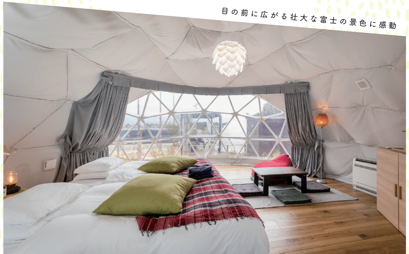
目の前に広がる壮大な富士の景色に感動

暖かな陽気にお出かけ気分が盛り上がる季節。アウトドア派ならキャンプを楽しむ方も多はず。そこで今号は、本格的なキャンプはちょっと…という方でも手ぶらで気軽に楽しめる「グランピング」をご紹介します。BBQや焚火のほか、温泉、サウナ、アクティビティなどもあり、なかには日帰りでも利用できる施設も。自然に抱かれながら贅沢な時間を過ごそう！