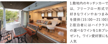
1.敷地内のキッチンカーでは、フリーフロー形式で好きなワインやおつまみを提供(15:00～21:00) 2.宿泊者にはハイクラスの選べるワインを1本プレゼント。ワイン愛好家にも人気