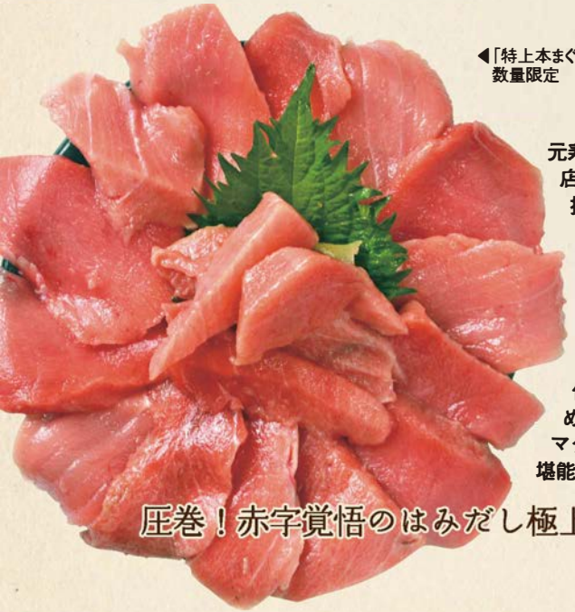
「特上本まぐろ中口井」▶ 数量限定 2,480円

元寿司職人が営む店は清水港で水揚げされたマグロのみを使用。本マグロの中口井は原価率90%超と赤字覚悟の一品だ。味の濃い部位を厳選するため、とろける脂とマグロのうま味を堪能できる。