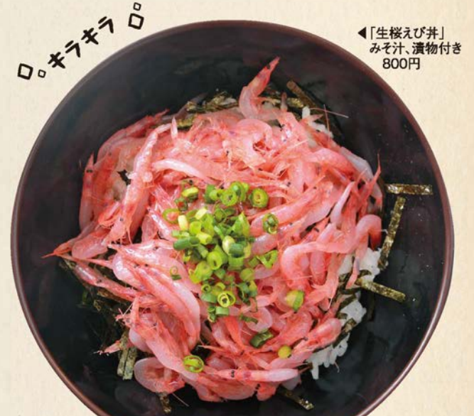
「生桜えび井」▶ みそ汁、漬物付き 800円