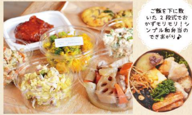
ご飯を下に敷いた2段式でおかずもりもり! シンプル和弁当のできあがり♪

090-7309-1700 / 静岡県駿河区大谷1-7-14 11:00~16:00 ※売り切れ次第終了 月・土・日曜、祝日休、ほか春・夏・冬に長期休暇あり / 10席 / P5台