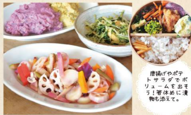
唐揚げやポテトサラダでボリュームを出そう! 箸休めに漬物も添えて。

夫婦の愛情がたっぷり詰まったお総菜 包丁で細く刻む方がおいしいからとスライサーや機械は一切使わず毎日早朝から夫婦で仕込みを開始する。地元食材を使い、一品一品手づくりを心がけた弁当や総菜は、それぞれ約10種が店頭に並び。