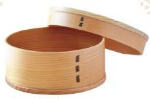
このお弁当箱に詰めたいよ!

055-900-1041 / 三島市泉町8-15 11:00~18:00 / 日・月曜休 5席 / Pなし