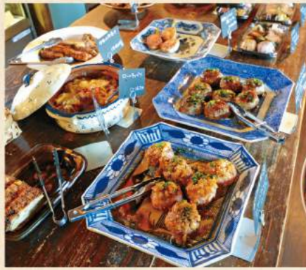
ゴロリと入れた根菜ハンバーグや鶏つくね、焼き野菜サラダで食べ応え充分!