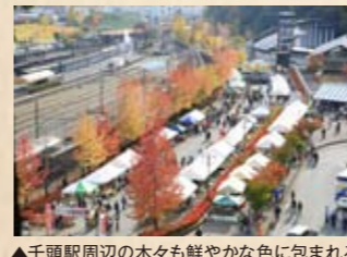
▲千頭駅周辺の木々も鮮やかな色に包まれる

車窓から眺める紅葉も素敵ですが、最寄り駅からひと足伸ばして、おすすめの紅葉スポットに出かけましょう。