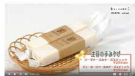
チーズケーキと焼菓子の店 poli poli 違いが分かる、厳選チーズの豊かな風味