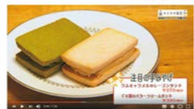
トラノコ洋菓子店 ちょっぴり大人。ほろ苦バタークリームサンド