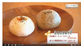
チクタク open the kitchen 和洋、甘味なんでもござれな万能おやき