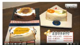
KettleWhistle BIGフルーツサンドは贅沢なケーキ仕立て!

2018年9月号「自慢のハンバーグ」~2019年12月号「注目の手みやげ」まで全編公開中!ぜひチャンネル登録してね!