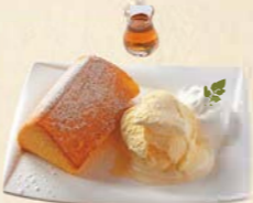
「自家製ふわふわフレンチシフォンケーキ」 800円