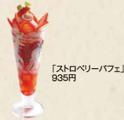
「ストロベリーパフェ」 935円