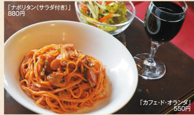
「ナポリタン(サラダ付き)」 880円