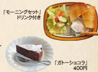
「ガトーショコラ」 400円