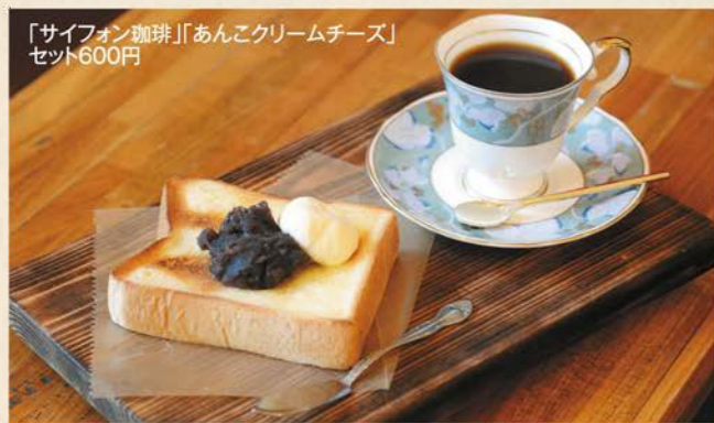
「サイフォン珈琲」「あんこクリームチーズ」 セット600円