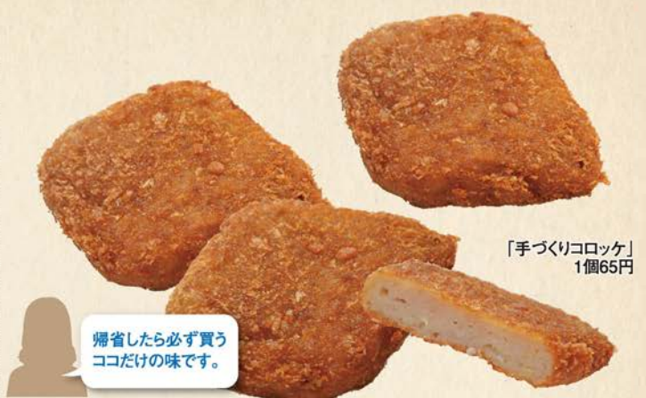
「手づくりコロケ」1個65円

0544-27-6494 / 富士宮市淀師468-2 10:30~18:00 / 月・火曜休 / 45席 / P25台