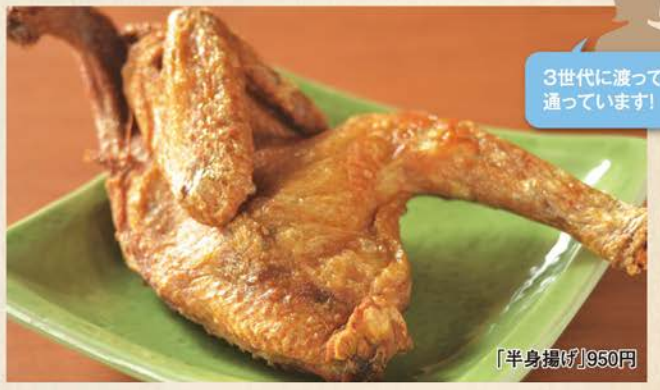
3世代に渡って通っています!

054-345-2218 / 静岡市清水区七ツ新屋2-4-23 11:00~13:30 (OS)、17:00~21:30 (OS) 月曜休 / 22席 / P12台