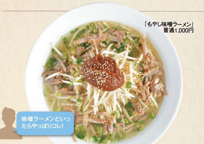
「もやし味噌ラーメン」普通1,000円

054-641-0316 / 藤枝市本町2-5-11 販売9:00~19:00、飲食11:00~15:00 (OS14:00) 17:00~21:00 (OS20:00) / 水曜休 飲食のみ40席 / P20台