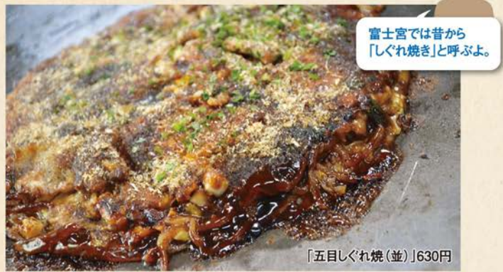
富士宮では昔から「しぐれ焼き」と呼ぶよ。