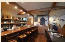
▲彩り豊かな「三島野菜カレー」918円。茶揚げやボイルで野菜の旨味が引き出される