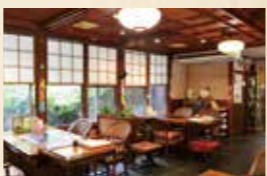
▲「ポーク夏野菜カレー」1,980円。写真のご飯は女性向けの小盛り105円引き