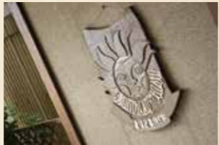
▲創業95年。先々代から受け継ぐまちのレストラン

054-352-0810 清水区港町2-6-19 11:30~14:00 (OS13:30) 17:00~20:30 (OS20:00) 月曜休/P5台