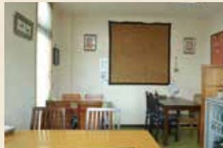
▲ワンコインでテイクアウトも可能

055-924-0776 沼津市東椎路10-7 10:00~21:00 ※月曜のみ10:00~14:00 日曜、祝日休/P共用300台