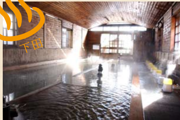
◀ 檜の香り漂う千人風呂。貸バスタオルは300円