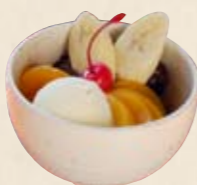
◀ 喫茶室でいただける「クリームあんみつ(お茶付き)」600円

伊東・松川沿いに佇む、昭和3年創業の旧旅館。現在は見学のみ(土日は入浴も可能)だが、門構えや障子など随所に職人技が光る日本建築は、見応えも十分。