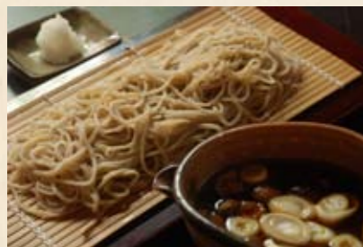
◀ 鴨汁につけていただく「鴨汁そば」1350円