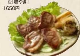
▶ 厚切りでジューシーな「鴨やき」1650円