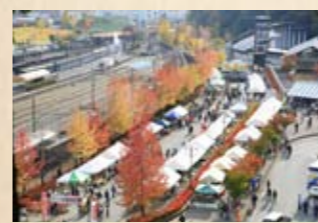
▲千頭駅周辺の木々も鮮やかな色に包まれる

車窓から眺める紅葉も素敵ですが、最寄り駅からひと足伸ばして、おすすめの紅葉スポットに出かけましょう。