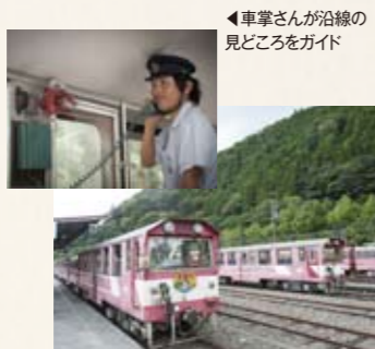
◀車掌さんが沿線の見どころをガイド

千頭駅から先は、赤いミニ列車に乗り換えて。日本で唯一のアプト式鉄道「南アルプスあぶとライン」は、奥大井の渓谷をゆっくりと進み、雄大な自然を間近で満喫できます。沿線の紅葉は11月に見頃を迎えます。