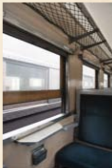
◀大井川鐵道の切符は、懐かしの硬券。駅員さんに許可をもらえば、持ち帰ることができます