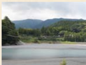
▶「塩郷」駅の近くは大井川で一番長い吊り橋をくぐります

昭和15年製造、熊本で昭和49年廃車。昭和40年には九州でお召し列車を牽引。煙突に残る2本のゴールドのラインはその名残だそうです。平成15年より大井川鐵道で営業運転。