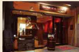
◀「マッシュルームの生ペーコン詰め」885円