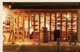
白ワインにぴったりの「ムール貝の薫製」500円▶

フランスの自然派ワインだけを取りそろえ、常時15~20種を楽しむ。気に入ったワインは購入も可能。ランチと一緒に昼飲みも最高だ。