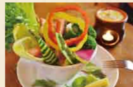
◀肉々しさがたまらない「タベスギータ肉」180g 1,050円。ペロリと食べられる▲「野菜トカ盛りバーニャカウダ」780円は彩りも鮮やか