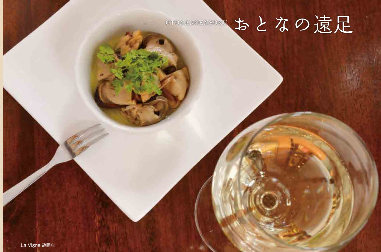
La Vigne 静岡店