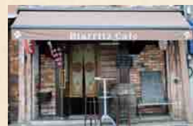
生ハムやピクルスの「盛り合せ」2,800円▶

三島広小路駅から徒歩1分。料理に定評のある大人の隠れ家的な店。おいしいバスク料理とワインの組み合わせで幸福の瞬間に浸ろう。