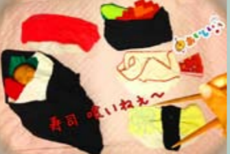
▲「寿司喰いねえ〜」やんもさん